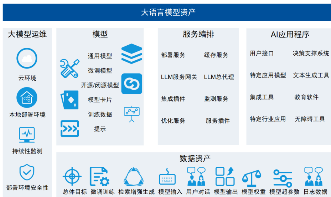
图 2: 大语言模型资产

本章节定义了实施、管理大语言模型（LLM）系统所必需的基础组件，涵盖了从模型训练、微调过程中重要的数据到确保 AI 系统完美部署和操作的复杂运维环境。同时，本章节也对 LLM 的必要性、架构、性能和优化技术作出了进一步阐述（详见图 2）。除上述内容外，本章节还探讨了资产保护的注意事项，此外，本节还探讨了资产保护过程中较为重要的几点，利用 RACI 责任分配矩阵（谁负责、谁批准、咨询谁、通知谁）来明确了开源社区组织在实施 AI 服务时的责任划分。